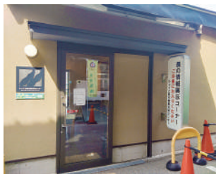
農の情報展示コーナーもあります。