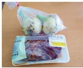
新たまねぎと自家製焼豚を購入。とてもおいしかったです。