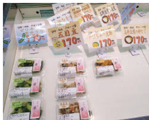
宝塚・西谷グループ夢さんのおそうじもありました!